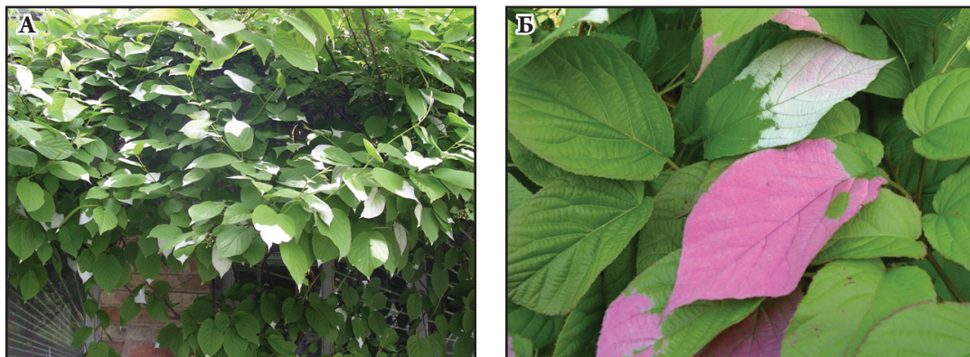
Рис. 1. Зміна забарвлення листків Actinidia kolomikta .